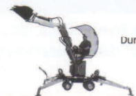
Durchfahrtsbreite nur 55 cm