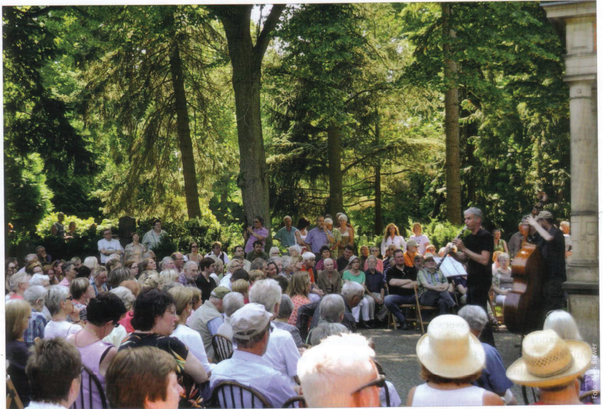
Ein Klezmer-Konzert auf dem Hasefriedhof gehörte zur Veranstaltungsreihe „Neues Leben zwischen alten Gräbern“.