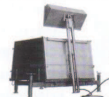
BoxLift passt zu jedem Container