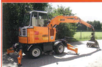
BOKI Mobilbagger 6552

Info durch: KIEFER GMBH MASCHINEN, FARBSTREIFEN UND VERTEILER Furter Str. 1, 84405 Dorfen, Tel. (08081) 414-0 www.kiefergmbh.de info@kiefergmbh.de