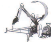
Durchfahrtsbreite nur 30 cm