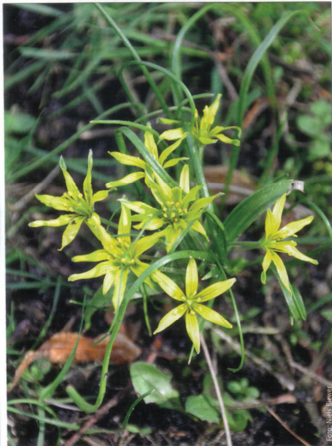
Lebensraum Friedhof: ein Goldstern (Gattung Gagea ) gefunden auf dem artenreichen Johannisfriedhof.