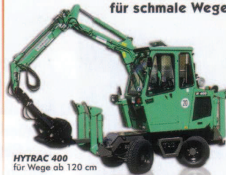
HYTRAC 400 für Wege ab 120 cm